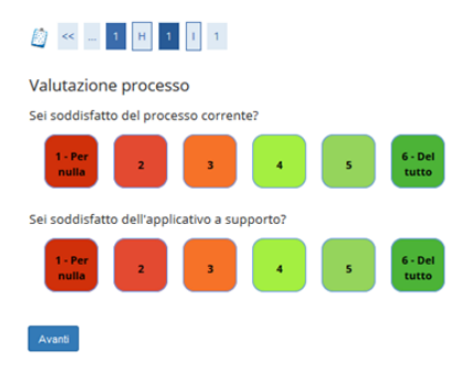
Fig. 17 Valutazione processo

18. After enrolment, select the payment from the menu. You will see the taxes already paid and the fee to pay to complete the enrolment (Fig.18). A red dot indicates that the fee has not yet been paid, a green one indicates that the payment has already been carried out.