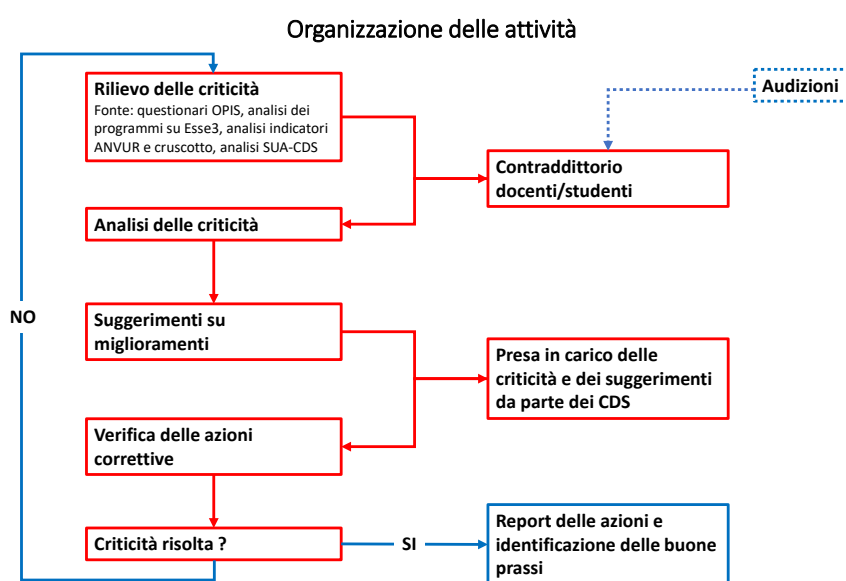
Figura 1: diagramma di flusso delle attività della CPDS.

Le attività della CPDS sono state organizzate conformemente al seguente diagramma di flusso (figura 1). Nel dettaglio l’analisi in contraddittorio delle criticità emerse nell’ambito delle analisi delle fonti sono state effettuate sia internamente alla CPDS, sia nell’ambito delle audizioni programmate con i CdS e svolte in data 11/03/2022 (CIM in Ingegneria per l’Ambiente e il Territorio), 24/03/2022 (CdL in Ingegneria Civile e Ambientale), 28/03/2022 (CIM in Ingegneria Civile), 26/04/2022 (CdL in Ingegneria Edile), e 04/05/2022 (CIM in Ingegneria dei Sistemi Edilizi).